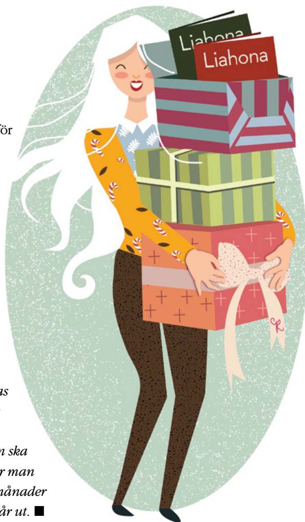
ILLUSTRATION RAMONA CHANTAF

För att prenumerationen ska löpa utan uppehåll behöver man göra en ny insättning tre månader innan prenumerationen går ut. ■